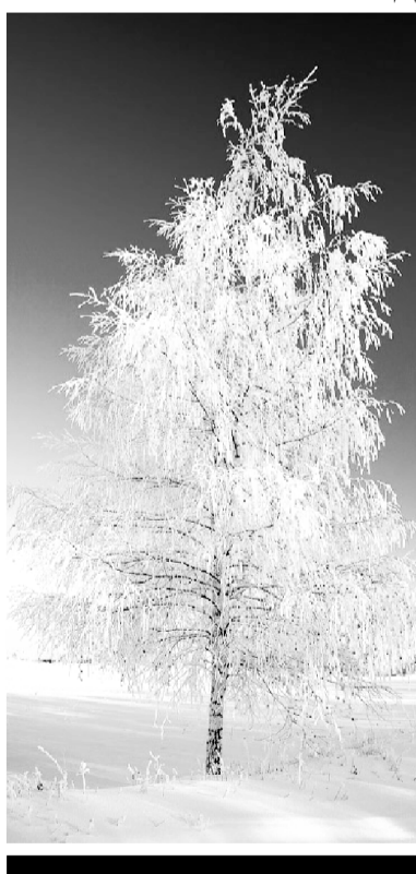
Не забудьте выписать газету «Бабынинский вестник»!